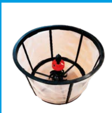
EINSPUELVORRICHTUNG MIT SIEB