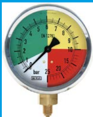
•MANOMETER VIKA DU 100