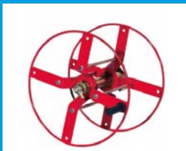
SCHLAUCHHASPEL E. 100 MT