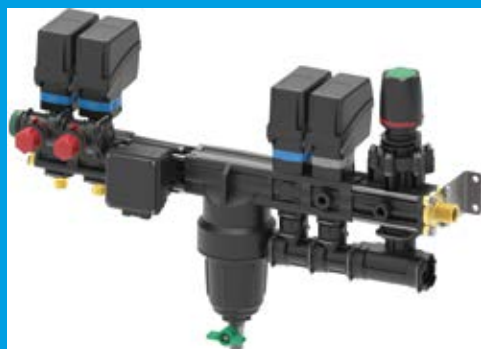
REGOLATORE DI PRESSIONE ELETTRICO