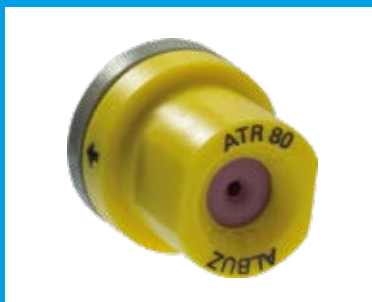
KIT UGELLI ALBUZ ATR