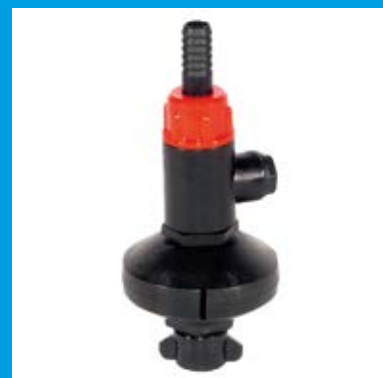
KIT LAVAGGIO INTERNO SERBATOIO