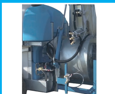
TRAITEMENT DU TRONC D'ARBRE