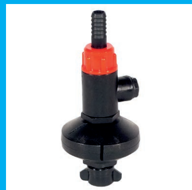
KIT POUR LE LAVAGE DES CISTERNES