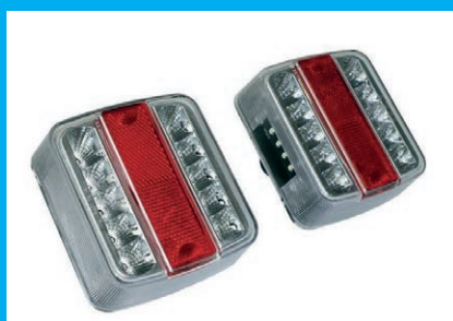
EQUIPMENT ÉLÉTRIQUE LED