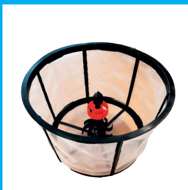
MÉLANGEUR HYDRAULIQUE SUR LE FILTRE