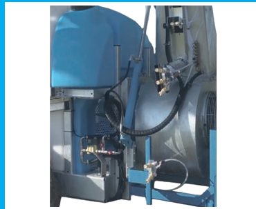
ZUSAETZL. DÜSEN ZU UNTERSTOCKBEHANDLUNG