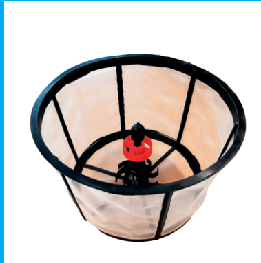
EINSPUELVORRICHTUNG MIT SIEB