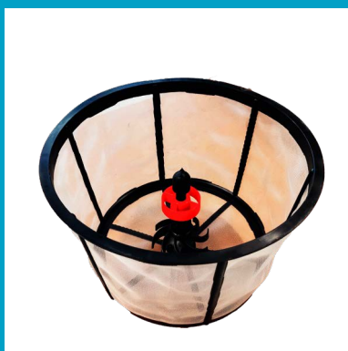
MÉLANGEUR HYDRAULIQUE SUR LE FILTRE