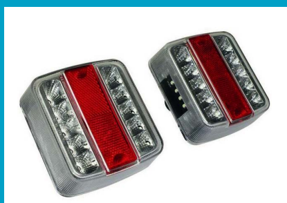
EQUIPMENT ÉLÉTRIQUE LED