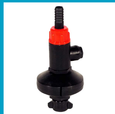
KIT POUR LE LAVAGE DES CISTERNES